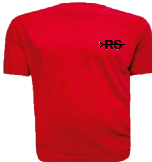
RANGERS Y ROVERS