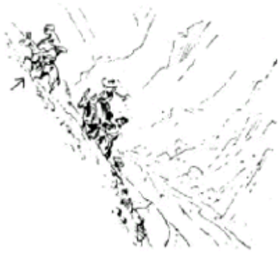
Trasmontando los Andes a lomo de mula