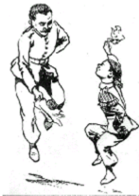
¿La cueca!? (baile nacional de Chile)