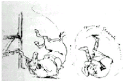
El Chileno es un jinete audaz

Los chilenos le parecen "una raza de soldados educados a la moderna y equipados al estilo alemán".