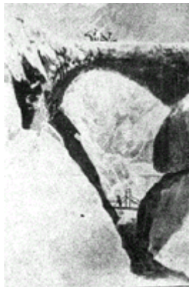
El Puente del Inca, obra de la Naturaleza

Al pasar por la cumbre, el general Baden Powell anota su impresión del Cristo de los andes. La imprevista estatua fundida con el bronce de los cañones, como un signo de paz en la frontera de Chile y la Argentina.