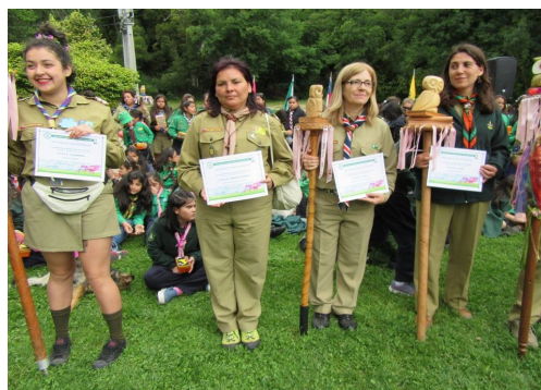
Guiadoras de Ronda recibiendo su Diploma de participación en la Nidada Nacional.