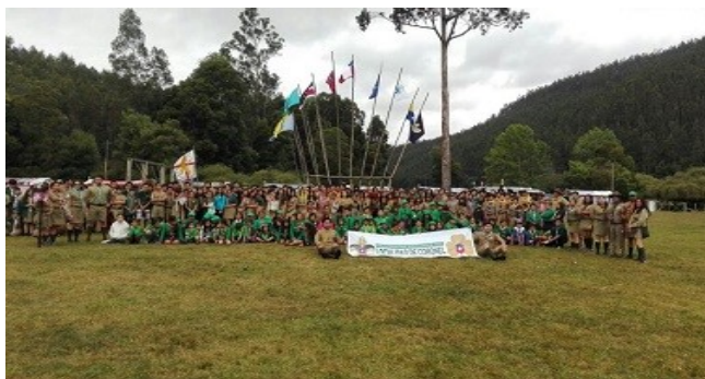
Campamento Local de grupos de Coronel