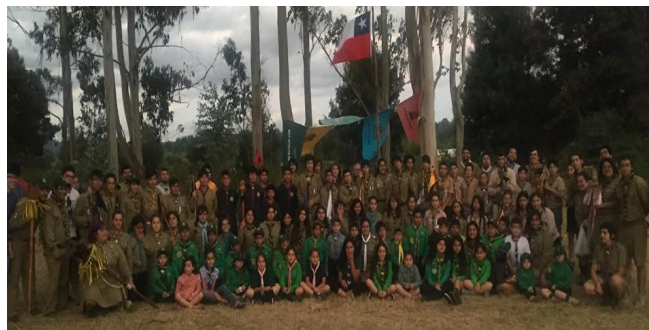
Campamento Provincial de Valdivia